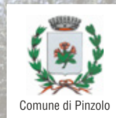
Comune di Pinzolo